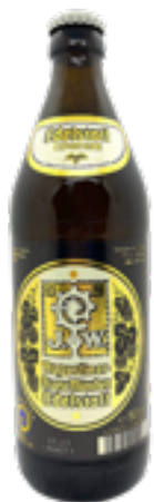
EDELSTOFF 5,6 % VOL